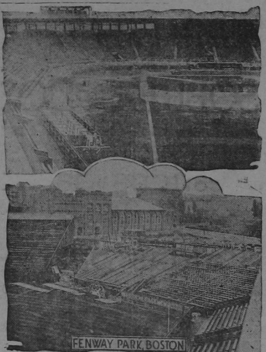
FENWAY PARK, BOSTON

BOSTON, octubre.—Fenway Park ha sido contratado para celebrar allí el campeonato mundial como único lugar capaz de contener el número de espectadores que se espera lleguen. Se han colocado sillas adicionales