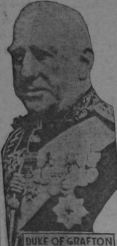
DUKE OF GRAFTON

LONDRES, octubre.—El duque de Grafton, de 107 años de edad, va paulatinamente convaleciendo del accidente que sufrió no hace mucho y que lo obligó a tomar cama. El Duque cayó en un cheque de automóviles. De las resultas del choque, varios amigos que viajaban con el Duque, todos ellos juveniles, fueron mal heridos; el duque resultó simplemente con una pierna dislocada. El dice que espera vivir aún 25 ó 30 años más.