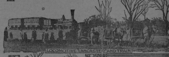
LOCOMOTIVE "LANCASTER" AND TRAIN