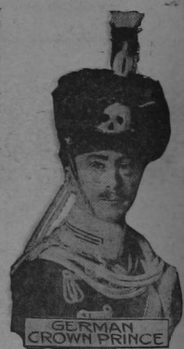
GERMAN CROWN PRINCE

BERLIN, Octubre. — El disgusto entre el Kaiser y su hijo mayor, el Principe Federico Guillermo, ha dado motivo a mayores comentarios, pero tanto una parte como la otra se han negado a informar sobre el particular. Se sabe ciertamente que su Majestad no reiertemente el Principe estuvo espandrá al frente del regimiento la pasada de su padre, pero esto envió a un representante suyo para revisar el regimiento. El Principe fué directamente ofendido con esto y así lo manifestó en ese momento.